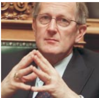
Joseph Deiss: fragwürdiges CVP-Wirtschaftsprogramm.

Bundesrat Joseph Deiss sieht bei kleinen und mittleren Unternehmen Handlungsbedarf in fünf Bereichen.